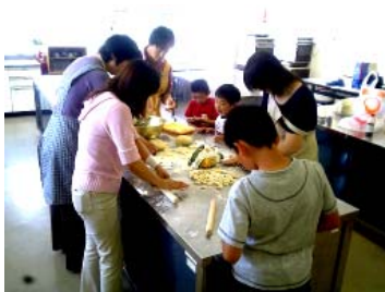
日本語支援教室での交流会

ほんわかでは2003年に実施した中国帰国者交流イベント「笑広場」(シャオシャオグアァン)をきっかけに、中国帰国者を取りまく問題をテーマにした事業をいくつか実施してきました。歴史学習会や料理教室では実施地域からも多くの方に参加していただくことができました。昨年度からは「中国帰国者を支える会」が帰国者の方と実施している日本語支援教室「快樂小組」(クアイルーシアオジエ)にメンバーが参加するなどの支援活動